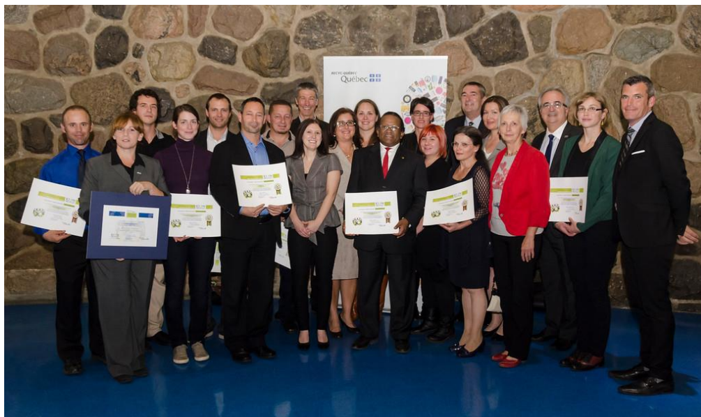
Remise des attestations ICI ON RECYCLE! niveau 3, régions de Laval et Montréal le 14 octobre 2014